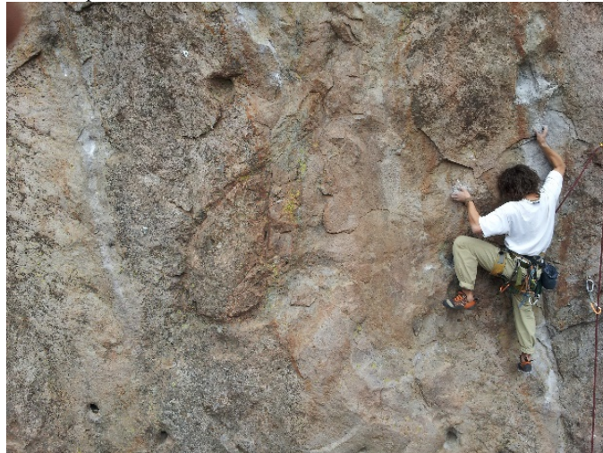
Figura 1. Imagen de Escalada Deportiva en Zona de Escalada Natural. Las Melosas, Región Metropolitana, Chile.

El organismo regulador de la escalada deportiva de competición a nivel mundial es la Federación Internacional de Escalada Deportiva IFSC, creada en Italia el año 1985. El año 2014 el Comité Olímpico Internacional Escogió a la Escalada Deportiva como deporte de exhibición en los Juegos Olímpicos de la Juventud en Nanjing, China (ISFC, 2014).