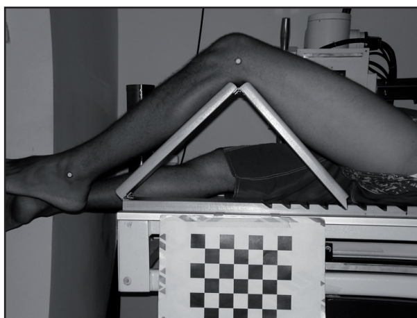
Figura 1: Posición 1

La tabla de cuádriceps fue utilizada para que el MII del evaluado se mantuviera en una misma posición durante la evaluación fotogramétrica y radiológica. El MII fue posicionado en dos ángulos diferentes: 1. Rodilla en mayor flexión (posición 1); 2. Rodilla más cercana de la extensión total (posición 2), como se puede observar en las Figuras 1 y 2. Cuatro voluntarios fueron evaluados en cada una de esas posiciones.