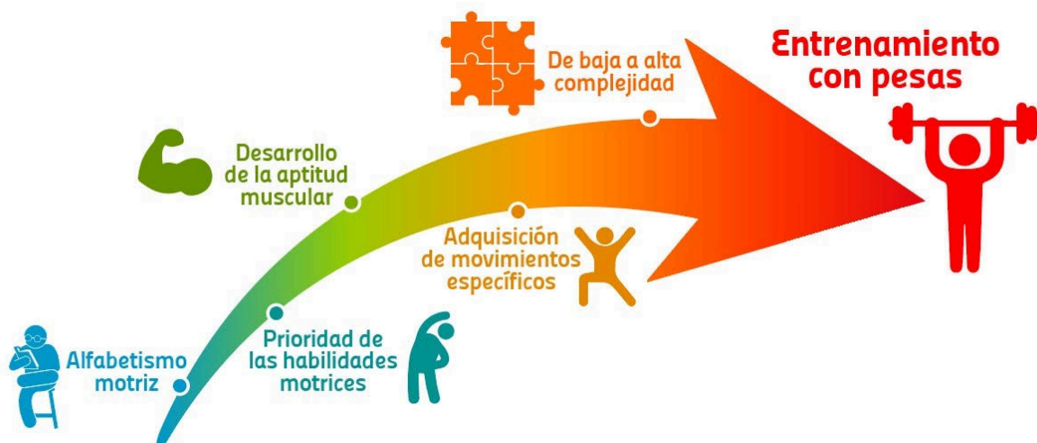
Figura 1. Proceso de desarrollo del entrenamiento de fuerza para niños, niñas y adolescentes.